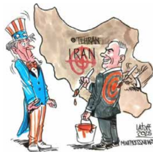
Beitrag vom 15.06.2025. https://www.instagram.com/p/DK7YhAqRTIs/ zuletzt aufgerufen am 16.04.2026.