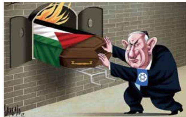
اثر واسکو گارگالو کارتونیست پرتغالی