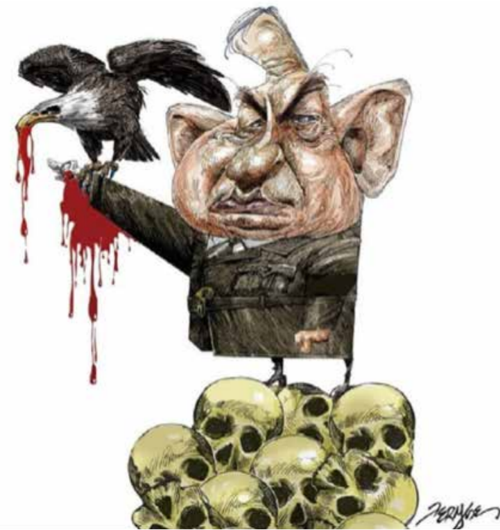
اثر فرناندس کارتونیست برزیلی