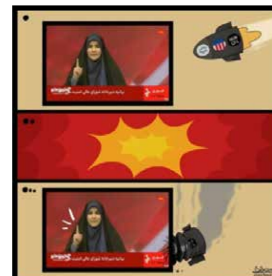
اثر جدید کمال شرف