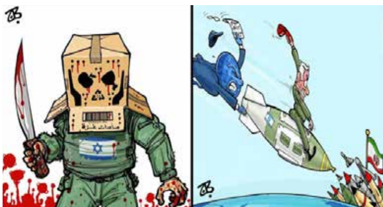
^ Übersetzt: Zwei Werke von Emad Hajaj Bildquelle: Originalquelle des verwendeten Bildes konnte trotz eingehender Recherche nicht ermittelt werden.