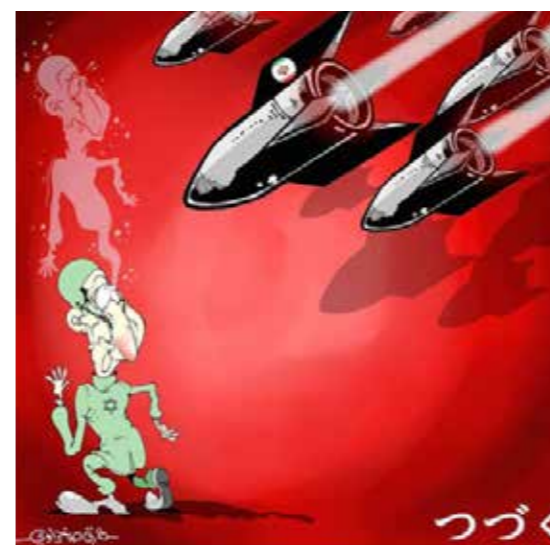
اثر طارق صخراوي از الجزائر

Die eingereichten Karikaturen enthielten sowohl tradierte antisemitische Stereotype als auch antiisraelische Feinbilder. 46 Aus den 1.200 Einsendung aus über sechzig Ländern belegte die Karikatur von Carlo Latuff den zweiten Platz, der mit einem Preisgeld von 8.000 US-Dollar dotiert war. 47 Vergleicht man die Karikaturen dieses Wettbewerbs aus dem Jahr 2006 mit den Veröffentlichungen der letzten beiden Jahre in den sozialen-Medien, so scheint es keine Scheu davor zu geben, den Hass auf Israel mit altbewährten antisemitischen Stereotypen zu untermauern. Auf der nächsten Seite sind einige solcher Karikaturen exemplarisch dargestellt.